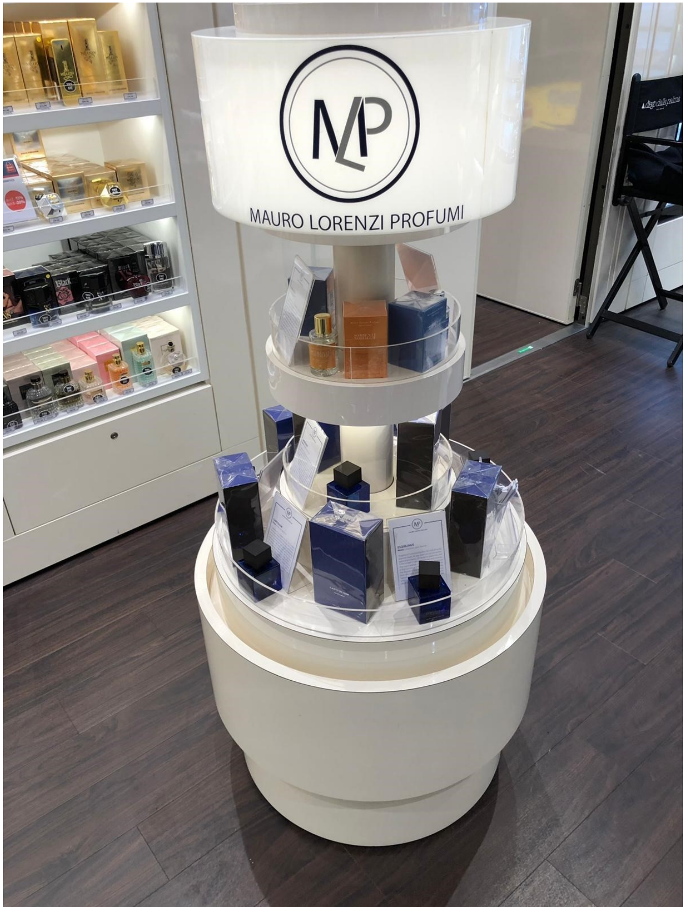
MSC Meraviglia. Boutique Profumi. "Mauro Lorenzi Profumi"